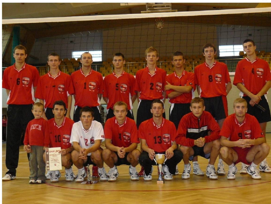
Fot 1. Kadra 2008-2009

Rok 2011 był rokiem jubileuszu 10-lecia występów siatkarzy Czarnych Oleszyce na ligowych parkietach. W ramach tych obchodów siatkarze rozegrali w minionym roku m.in. turniej siatkówki plażowej i halowej, a w grudniu spotkali się na jubileuszowych uroczystościach.