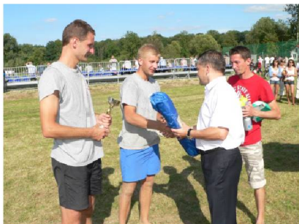
Fot. 2 Turniej Siatkówki Plażowej