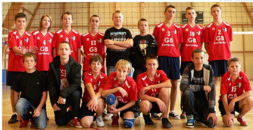
Fot. 3 Sekcja Młodzików