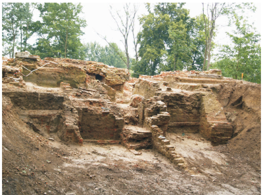
Fragment fundamentów ściany wschodniej pałacu.

Analiza topograficzna i stratygraficzna założenia pałacowo-parkowego w Oleszycach pozwala zakładać, że wzgórze zamkowe powstało w wyniku celowego odcięcia głęboką fosą eksponowanego cypla stromo opadającego w kierunku doliny rzeki Przerwy. Ziemię pochodzącą z fosi oraz zapewne częściowo ze splantowanego parku i ogrodu nawieziono na odcięty cypel, kształtując go w okresie nowożytnym w czworobok z bastionami. W ten sposób podniesiono walory obronne założenia.