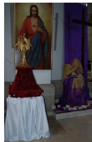
Relikwie św. Józefa Bilczewskiego w kościele pw. Narodzenia Najświętszej Maryi Panny w Oleszycach