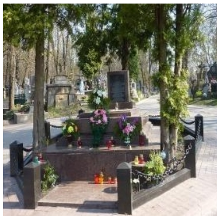
Grób św. Józefa Bilczewskiego na Cmentarzu Janowskim we Lwowie

Pobyt abp. Józefa Bilczewskiego, Metropolity Lwowskiego, w Oleszycach wiąże się z tragicznym pożarem, który miał miejsce 11 maja 1901 roku. Spaliły się wówczas: