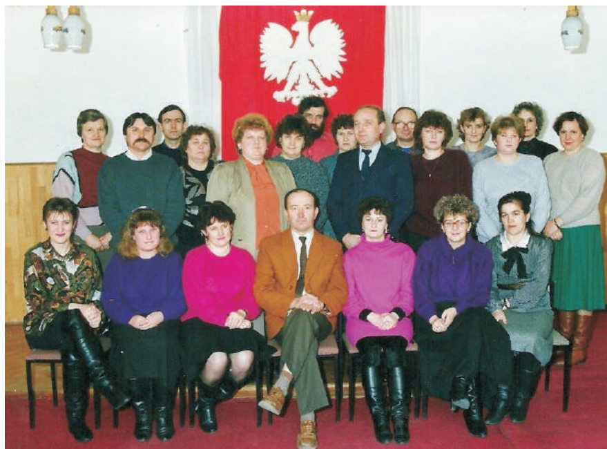
Pracownicy urzędu Miasta i Gminy Oleszyce – 1991 r.